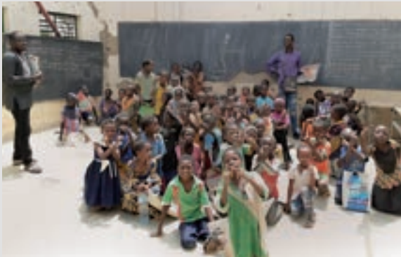
Activité de soutien psychosocial au profit des enfants affectés par la crise à Zékézi.