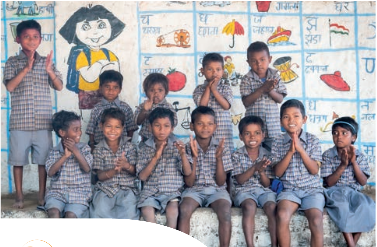
© Action Education – Chandra Kiran